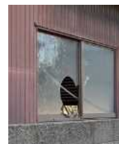
窓が割れた 管理不全空家