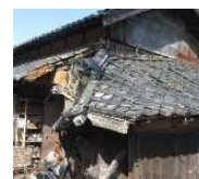
緊急代執行を要する 崩落しかけた屋根