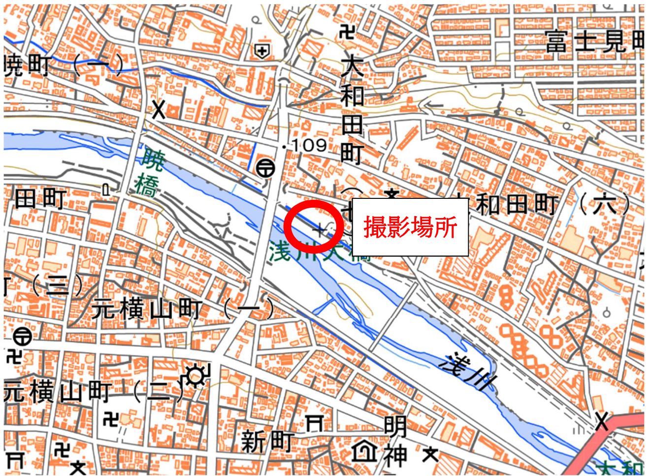
撮影場所：八王子市 浅川大橋付近