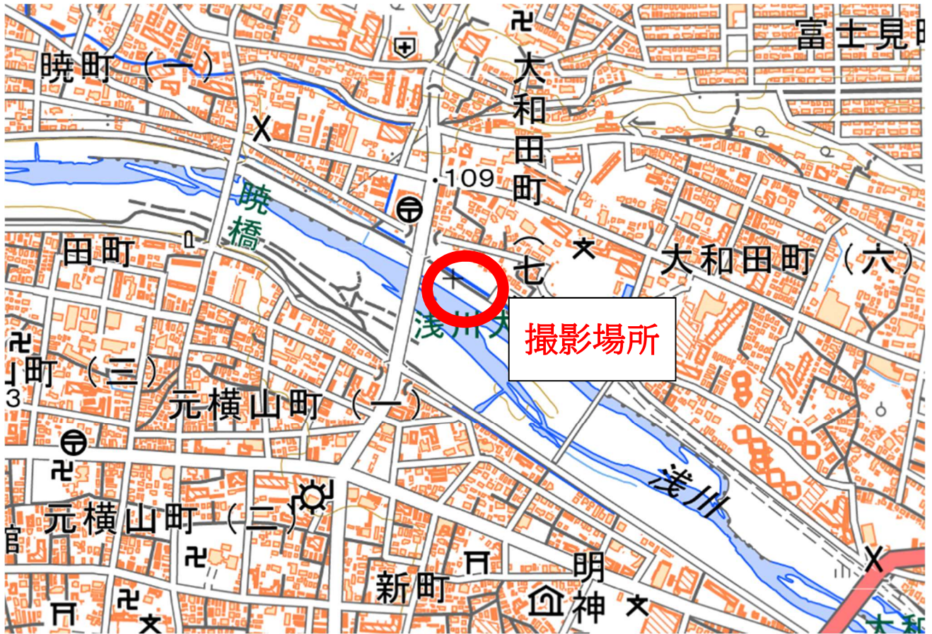
撮影場所：八王子市 浅川大橋付近