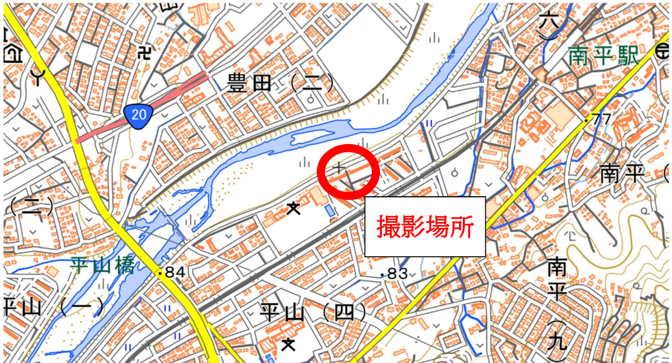
撮影場所：日野市・平山ふれあい広場付近