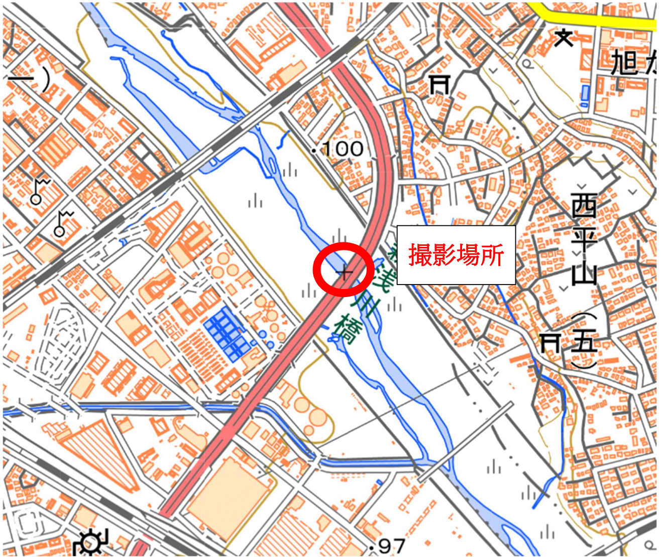
撮影場所：八王子市・新浅川橋からの浅川