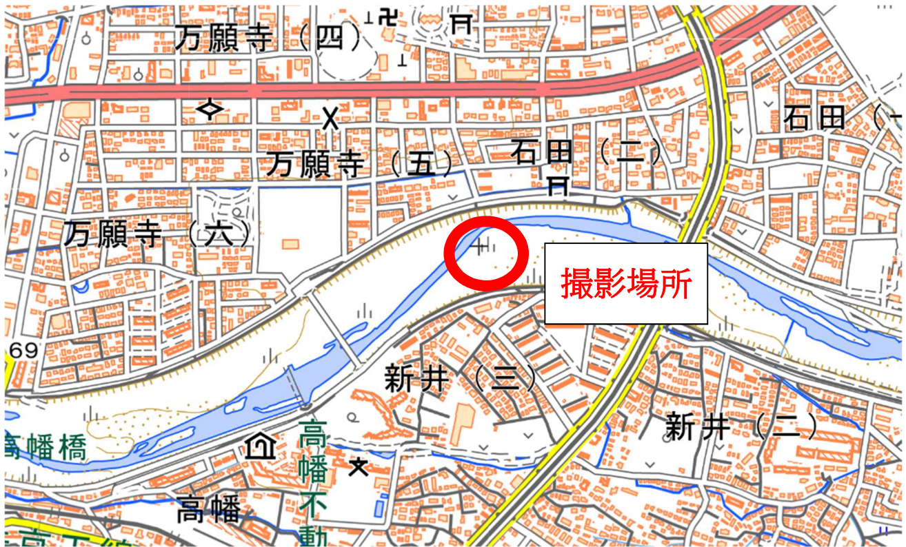
撮影場所：日野市・新井橋上流