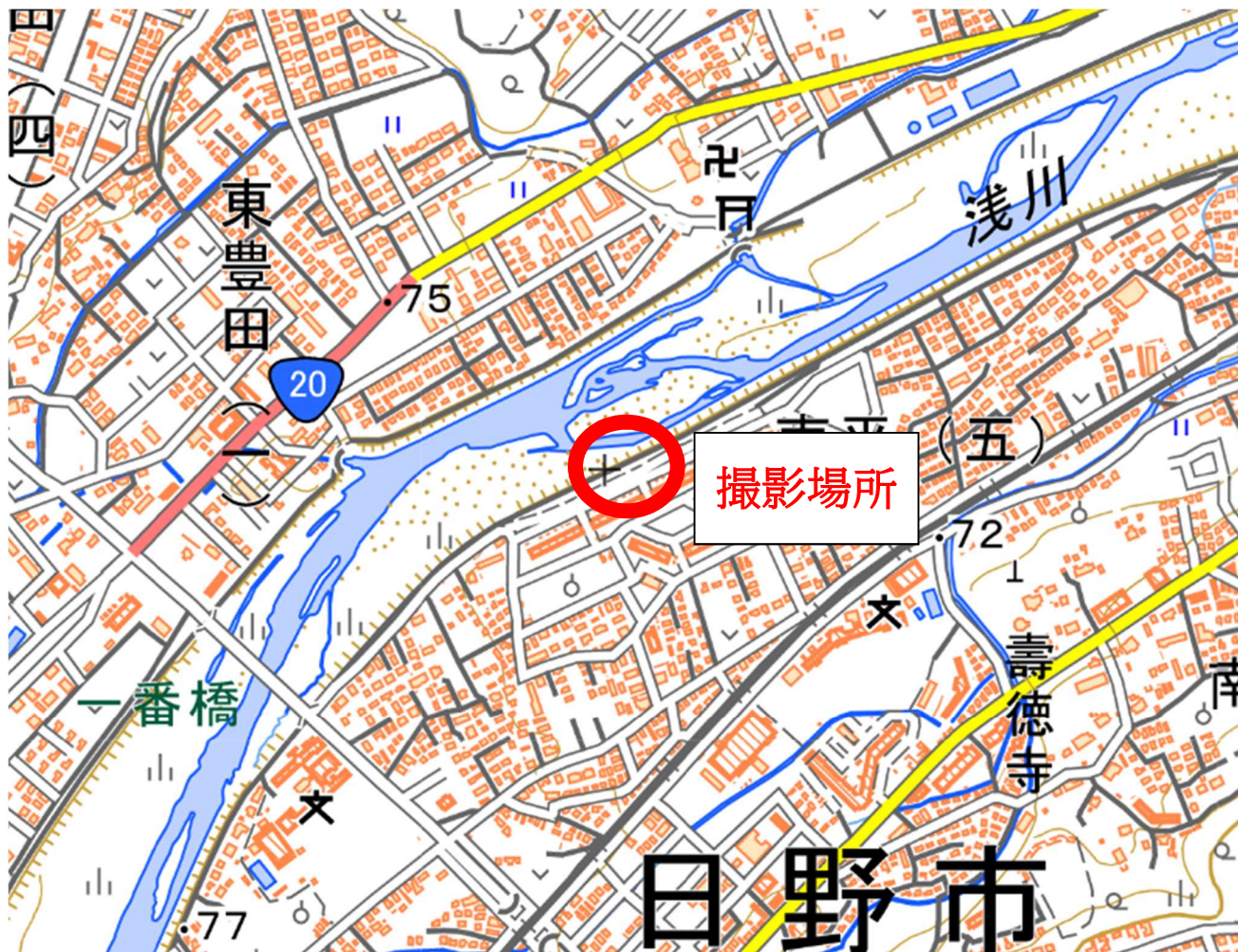
撮影場所：日野市・一番橋下流