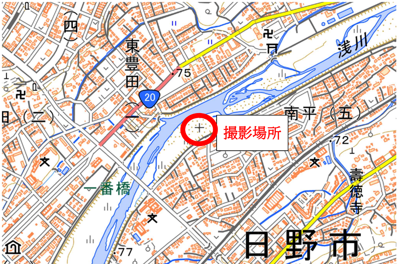
撮影場所：日野市・一番橋下流