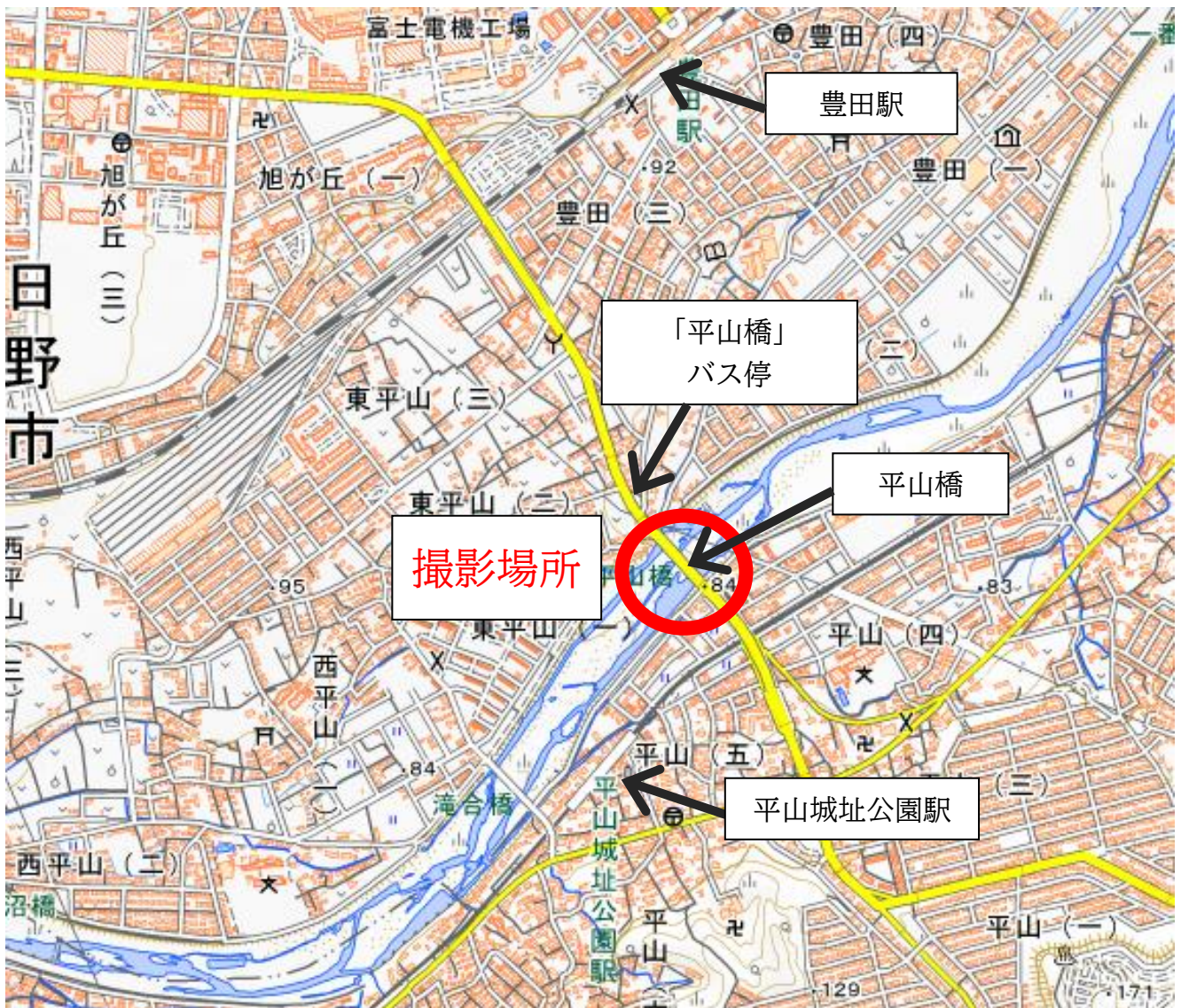
撮影場所：日野市 平山橋