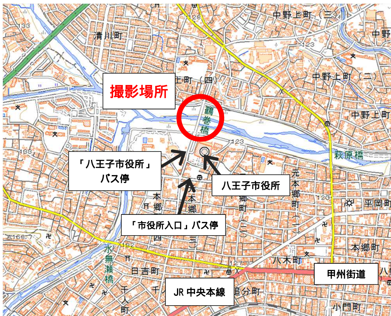
撮影場所：八王子市 鶴巻橋周辺