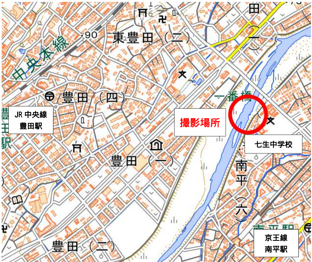
撮影場所：日野市 七生中学校北側