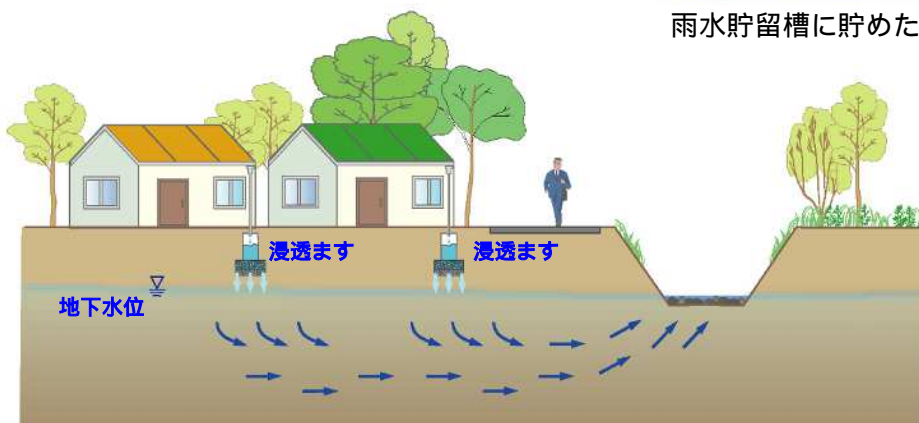
雨水浸透施設(浸透ます)からしみ込んだ雨が地下水となります。