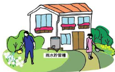
雨水貯留槽に貯めた雨水を活用

雨水を地下へ浸透させることで地下水をかん養するとともに、ゲリラ豪雨など都市型水害の軽減に役立ちます。また、雨水貯留槽の水を庭の水やりなどに使うことで水道代の節約になるほか、災害時への備えにもなります。