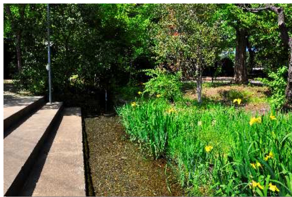
【写真】特に湧水量の多い 子安神社(中野山王)