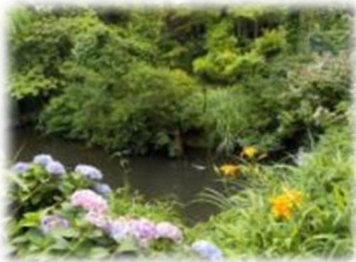
自然に囲まれた素敵な池です

水路のすぐそばには、私たちの所有する池があります。周辺の湧水が流れこんできているので、水量が豊富で鯉や亀が生息し、時折サギも訪れます。池の周囲にはミョウガや山椒が生えており、食材の宝庫となっています。また、自分たちでも花を植えたりして、憩いの水辺空間づくりを楽しんでいます。安全上、池の敷地内には立ち入ることはできませんが、外から池を見ていく方々も多くいらっしゃいます。