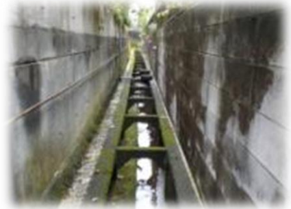
水路は清掃が行き届いています

その後、時代の変化とともに田んぼが宅地へと変わり、水路も上流部の方は無くなり、素掘りの水路からコンクリートの水路に変わりましたが、今まで水の流れが絶えたことはありません。