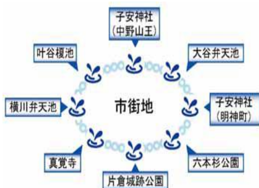
「八王子湧水ネックレス構想」イメージ

「叶谷榎池」「六本杉公園」の他にも、八王子市内にはいくつもの湧水があります。ここでは代表的な「八つの湧水」を紹介します。