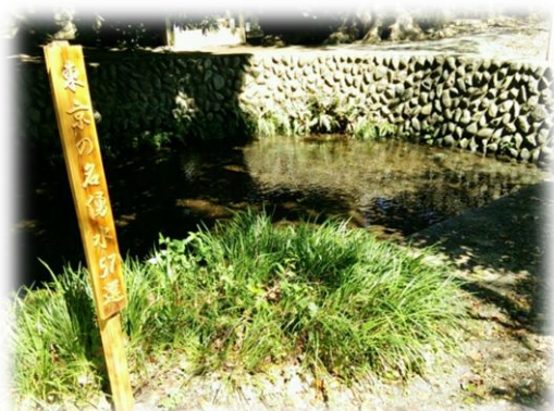
子安神社の湧水は「明神様の泉」として昔から親しまれ、水量も豊富です。

「叶谷榎池」のほかにも、八王子市内には「東京の名湧水 57 選」に選ばれた湧水が 4 か所あります。