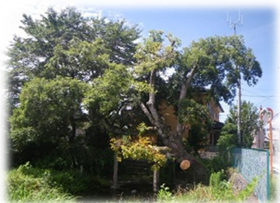
叶谷榎池のシンボルツリー

語源には定説がなく、餌の木(小鳥が好む)、枝の木(枝が多い)、柄の木(器具の柄に使われた)。さえのかみ(道祖神)の木→「さえのき」など様々。