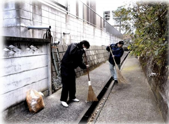
こまめな清掃活動で 水路はいつもきれいです

水は限りある資源であり、小川を汚すことは私たちが日常使う水をも汚しているのです。このことを地域の取り組みや水護り制度などによって知ってもらう必要があるのではないのでしょうか。