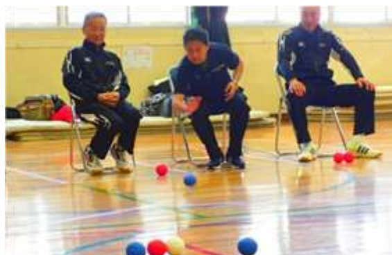
障害のある人もない人も楽しむことができるポッチャ