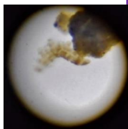
エサの藻(右上のかたまり)を食べるクマムシ

対象/どなたでも 定員/各回 6 組(申込順) (保護者を含めて 3 名まで入室可) 費用/無料