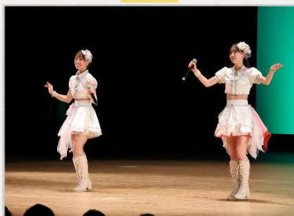
アトラクションの企画