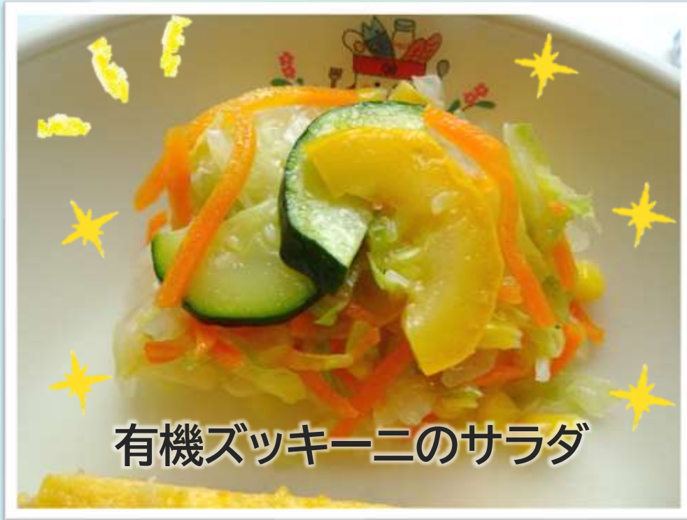
有機ズッキーニのサラダ