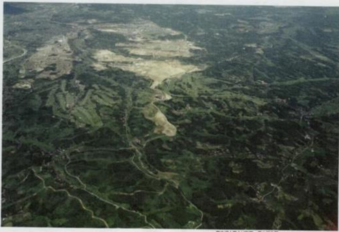
南大沢上流より別所・豊木田の田 撮影日不明