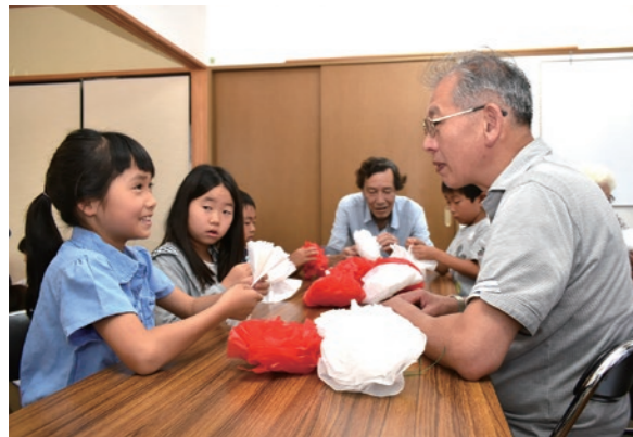
地域の人と一緒に祭りの準備

夏休みには、家族で山や海などの豊かな自然にふれてみたり、興味があることを時間をかけて調べてみたりするなど、普段ではできないことに挑戦してみよう。また、クリーン活動やお祭りなど、積極的に地域の行事に参加し、多世代の人たちとふれあい、地域のためにできることを探してみるのもよいでしょう。新たな自分の魅力に気付いたり、これまで以上に自信を持てたりするようにもなります。