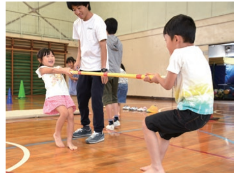
棒をしっかり握って足を踏ん張って

第七小学校で、6年生がパラリンピック競技について学ぶ取り組みの一環として、パラスポーツ「ゴールボール」を体験。目隠しをして耳でボールの動きを聞き分ける競技の難しさに驚いていました。