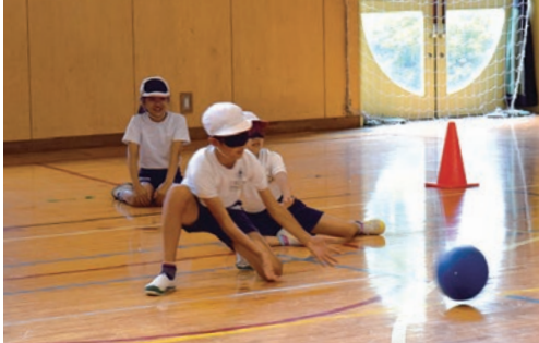
ボールの行方を耳で追って

市立小・中学校では、東京2020オリンピック・パラリンピック競技大会を契機に、子どもたちのスポーツへの関心や障害者理解などの資質を育成するため、オリンピック・パラリンピック教育を実施しています。 問い合わせ 指導課(☎620・7405、☎627・8811)