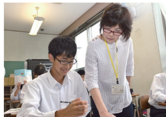
「わかった」「できた」を実感

1学期が終わり、ほっとする夏休みは生活が不規則になりがち。規則正しい生活を送るよう心がけましょう。また、毎日計画的に継続して家庭学習に取り組むことも大切です。1学期を振り返って、解けなかった問題や苦手な教科の復習をするなど、自分の課題をみつけて、改善できるように取り組んでみましょう。