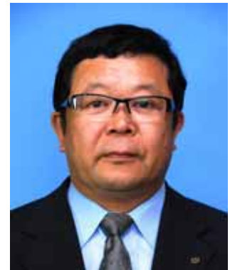
教育長 坂倉 仁 (さくら ひとし)