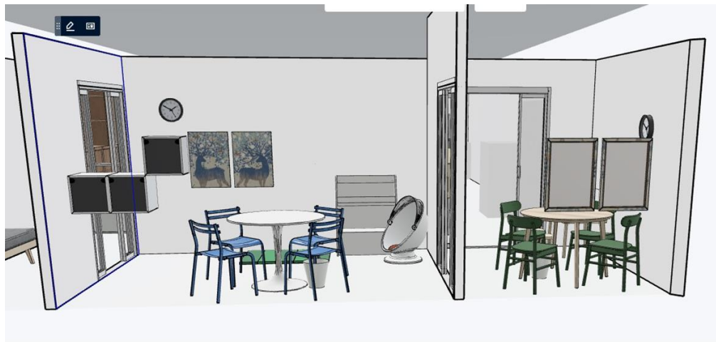
<地域子ども家庭支援センター東浅川 相談室 パース(完成予想図)>

子ども施設を支援するための「子ども募金」。この取り組みは、お客様が「IKEA FAMILYカード」を呈示しお買い物をするごとに、イケア・ジャパンが10円を積み立てます。この募金を活用し、全国のイケアストアでは、ストア周辺の子どもの関係の施設へイケアの商品を寄付します。また、商品の寄付だけでなく対象施設のインテリアデザインから設置まで行います。