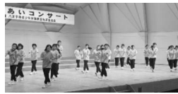
第五中学校ダンス部