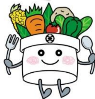
はちおうじ食育キャラクターはっちくん

血糖値や血圧、コレステロールなどが影響しています。野菜や塩分に気を付けることが大切です！