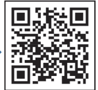
八王子市予約専用サイト

八王子市予約専用サイト： https://hachioji.hbf-rsv.jp/