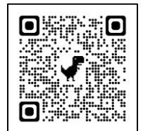
八王子市 ホームページ