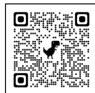
八王子市 ホームページ

インターネットで医療機関を探すことができない場合は、 八王子市コールセンター(0120-383-183)へお問い合わせください。 ※翌月分の予定については、前月中旬ごろに公開いたします。