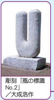
彫刻「風の標識 No.2」 /大成造作