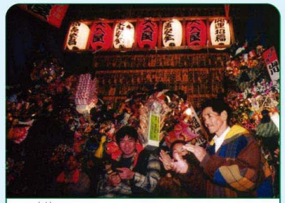
お酉さま 八十八景 まつり・行事の景 毎年11月の酉の日に市守神社で行なわれる酉の市。