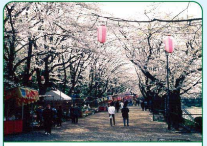
景観100選 八十八景 みどり・公園の景 富士森公園 桜の名所。満開の頃は人出も多く花見客で賑います。