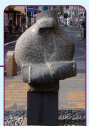
彫刻「友の顔 (逢々) I」 /酒井良作

八十八景 まつり・行事の景 しょうがまつり 毎年9月上旬に行なわれる永福稲荷神社の例祭。