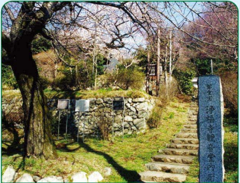
浄福寺 八十八景 歴史・文化の景

利用時間…午前9時～午後4時30分 (11月～3月は午後4時閉園) 入園料…大人 200円 中学生以下 100円 4歳未満 無料 駐車場無料 (200台)