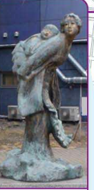
彫刻「若き日の母」 北村西望作