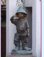
彫刻「将軍の孫」 北村西望作

所要時間・消費カロリー・歩数の数値 各コースの所要時間・消費カロリー・歩数は、時速4km、ウォーキング10分=30kcal、1歩=70cm、体重60kgの場合で算出しています。総距離数に、公園内の距離は含んでおりません。