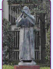
彫刻「和の角笛」 井上久照作