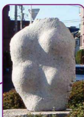
彫刻「四つの形」 渡辺隆根作