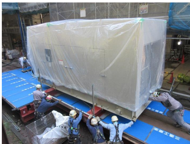
非常用発電機搬入状況