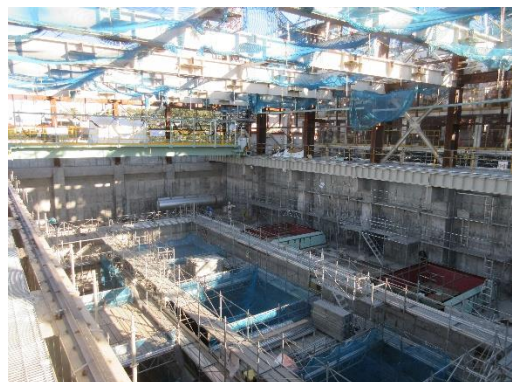
ごみピット上部施工状況