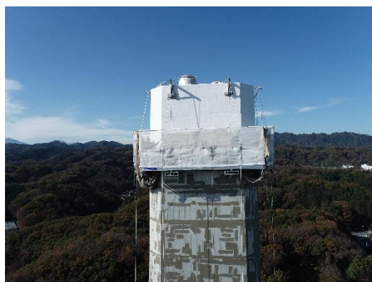
煙突塗装・下処理状況