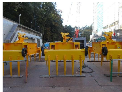
クレーンバケット