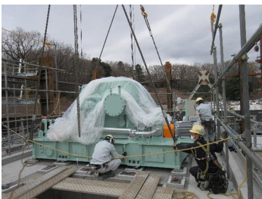
蒸気タービン据付の様子