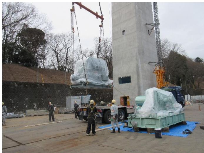
蒸気タービン発電機の搬入の様子

蒸気タービン発電機の搬入・据付を行いました。本施設では、焼却したごみが持つ熱を蒸気に変え、そのエネルギーを利用し、蒸気タービン発電機にて発電を行います。ごみ発電は一般的にごみ処理の過程で消費するエネルギーよりも高いエネルギーを生産でき、二酸化炭素排出抑制に寄与するといわれています。