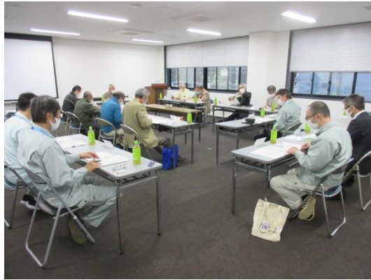
運営協議会の様子