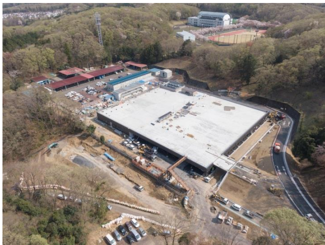
4月上旬の上空からの様子