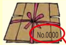
须记载登录号码 或营业所名称