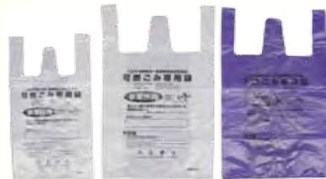
可燃垃圾专用 不可燃垃圾专用