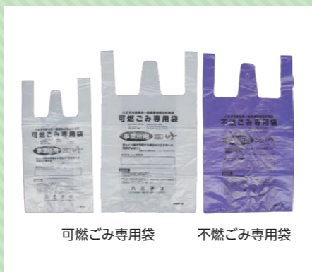
可燃ごみ専用袋 不燃ごみ専用袋