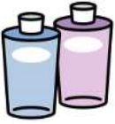
プラスチック製品