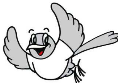
「 リサイクルマスコット「クルリ」 」

ごみ減量キャンペーンの一環として、市民からリサイクルのシンボルマークを募集し、平成4年度に最優秀作品を本市のシンボルマークに決定した。