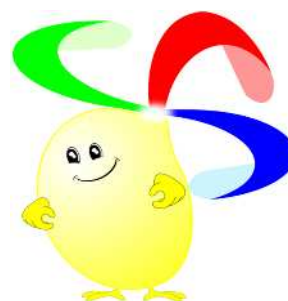
「 戸吹クリーンセンターマスコット「プクリン」 」

マイバッグ持参運動を開始するに当たり、平成17年度に市民から公募し、マイバッグシンボルマークを決定し、市が作成したマイバッグ等に印刷してマイバッグの普及に活用している。