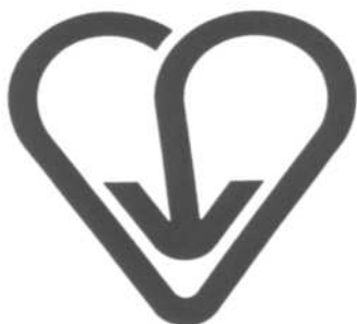
「 ハート・リサイクルはちおうじ 」

心の豊かさゆとり、ものの大切さをハートで表現し、矢印でリサイクルを象徴している。