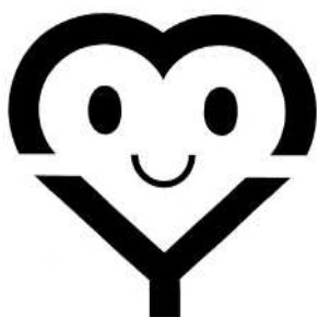
「 マイバッグシンボルマーク 」

市民に親しみやすくリサイクル意識を啓発するために、平成5年度の第4回リサイクルまつりでリサイクルマスコットを募集。市の鳥「オオルリ」に決定し、翌年の第5回リサイクルまつりで「クルリ」と命名。市のポスター、ちらし等の印刷物に掲載し、広く市民にリサイクルを呼びかけている。