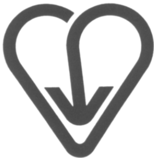
ハート・リサイクルはちおうじ

さらに、マイバッグ持参運動を開始するにあたり、平成17年度に市民から公募し、マイバッグシンボルマークを決定し、市が作成したマイバッグ等に印刷してマイバッグの普及に活用している。