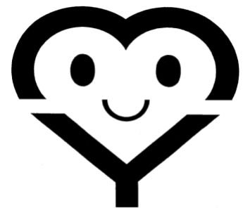
マイバッグシンボルマーク

英字のMYをハート型にデザインし、微笑む顔にすることで、マイバッグを持つ人の「レジ袋はいりません」というごみ減量へのやさしい気持ちを表現している。