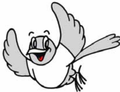
リサイクルマスコット 「クルリ」