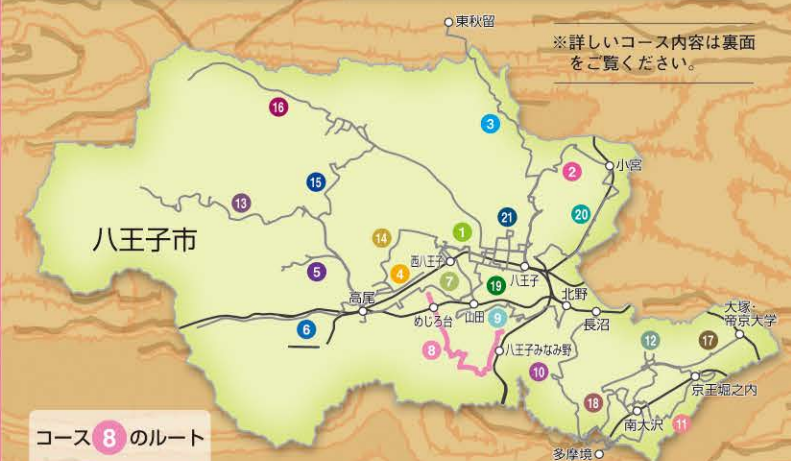
コース 8 のルート