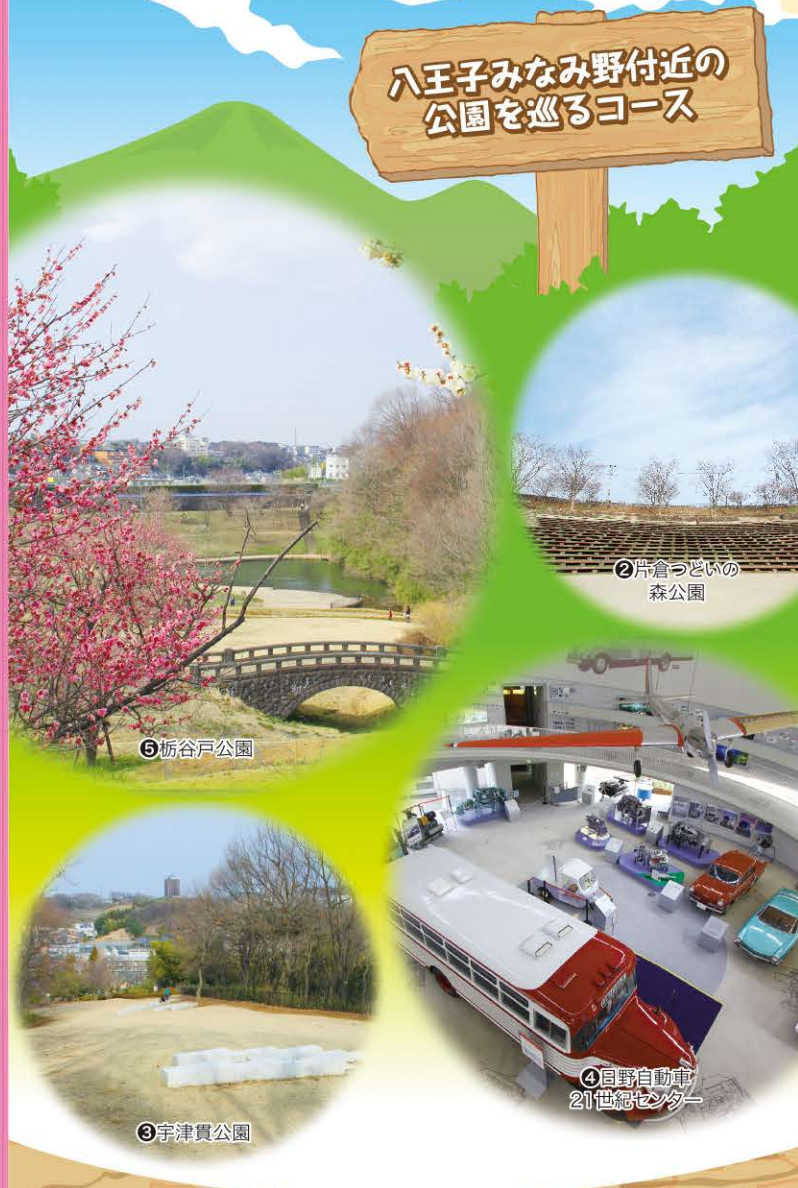
②片倉つどいの 森公園