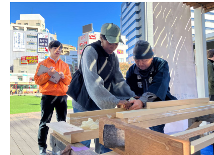
▲事務局スタッフが必要に応じてサポートします。