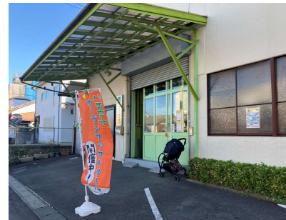
▲当日使用する目印ののぼりを配布します。

また、イベント保険の加入も予定しております。 (詳細は後述の参加企業ミーティングにてご説明します。)