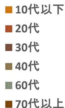
2025年 参加者年代構成

企画したプログラムの提供をお願いします。 参加者が安全に楽しむことができるような環境下での実施をお願いします。(事務局でもイベント保険加入予定) 体験の様子など写真を撮って、可能な限りSNS等での情報発信をお願いします。