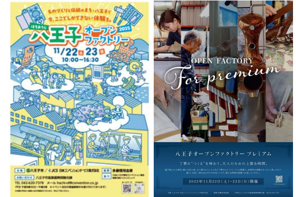
▲昨年度作成ポスター