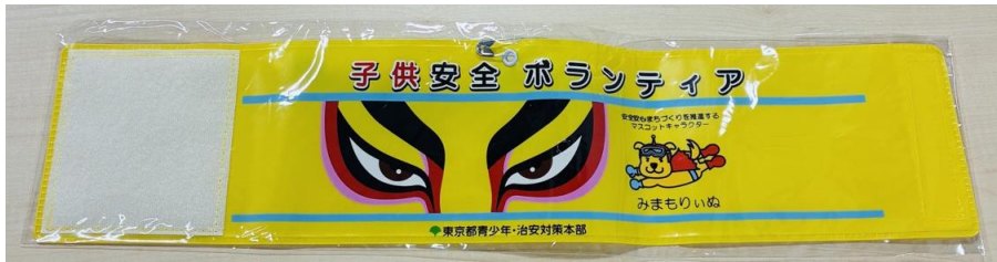
東京都 見守り腕章

市防犯課では、ながら見守り活動に役立つグッズを配布しています。 防犯効果を高めるためにも、ぜひ着用をお願いします。 ※数に限りがあるため、配布個数を制限する場合がありますのでご了承ください。