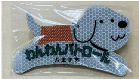
八王子市 わんわんパトロール用リードカバー