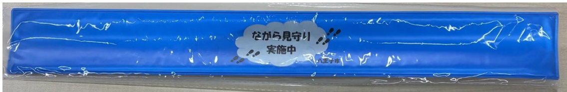
八王子市 ながら見守り腕章