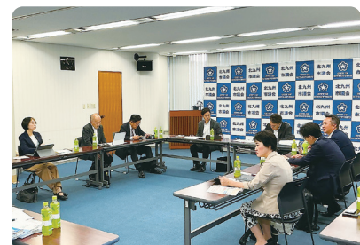
10/17 行政視察 (北九州市)