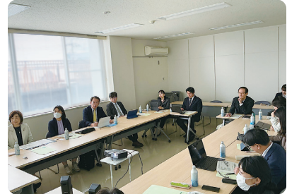
11/5 行政視察 (こども若者支援センター「ココエール」)