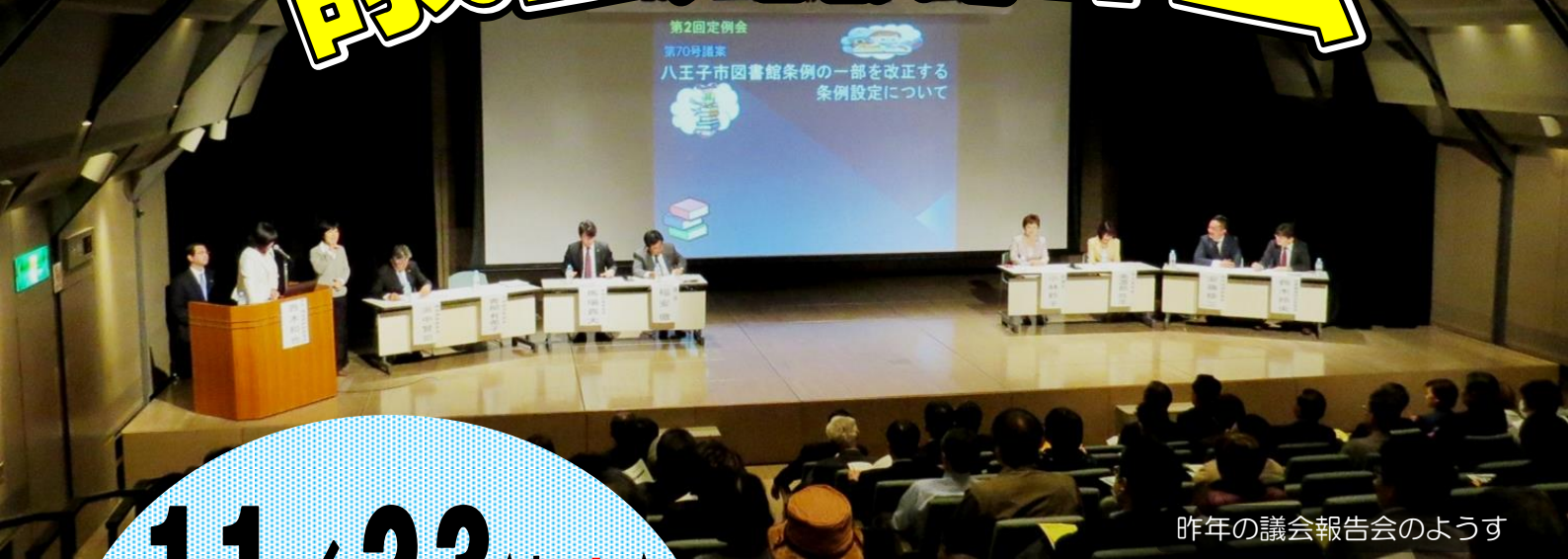
昨年の議会報告会のようす