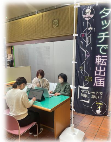
転出ワンストップのサポート