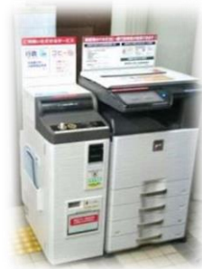
キオスク端末のサポート