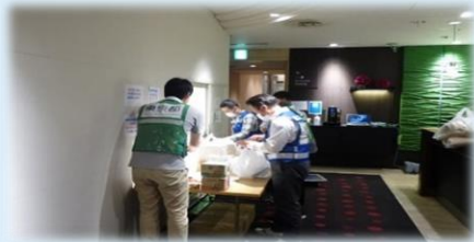
都・市・医師会による共同運営

市内で再度の開設に当たっては、近隣住民説明会等の地元調整等を積極的に行い、都に協力し施設開設を実現させた。