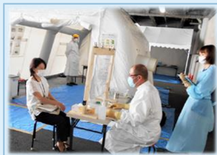
医師会医師による PCR 外来での検査

医療機関のひっ迫を防ぐため、PCR 検査に特化した専門外来を医師会の協力を得て開設し、発熱患者診療と一般診療をすみ分けることにより、市内の医療崩壊を防ぐことが出来た。