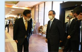
菅義偉総理大臣（当時）による市役所本庁舎接種会場視察