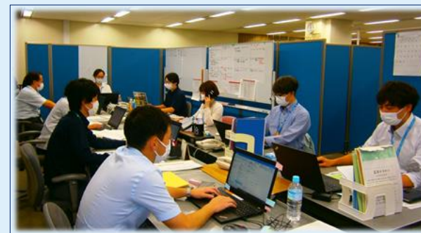
地域医療体制支援拠点

※発症から 10 日間、かつ症状軽快後 72 時間経過した患者について、原則、PCR 検査を実施せず、後方支援施設または高齢者支援施設等へ転院可能とするルール。