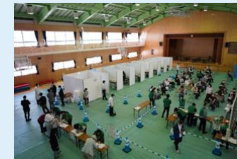
小学校での集団接種の様子