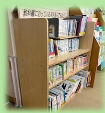
先生からの依頼で 本棚を作成