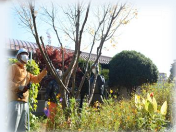
(横川小用務員 × 横川中用務員)