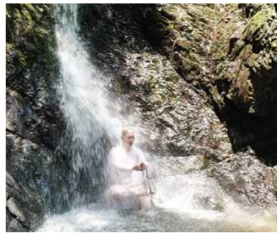
琵琶滝で水行を体験