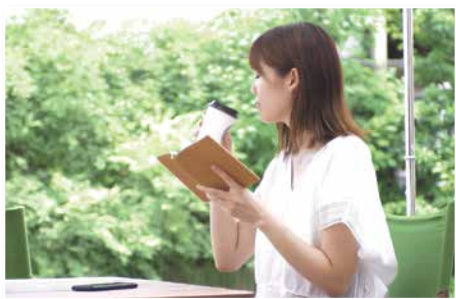
コーヒーなどを楽しみながら読書を (写真はイメージ)

集いの拠点整備課 ☎620・7348 FAX627・5931 図書館課 ☎664・4321 FAX662・2789