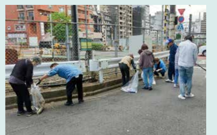
みんなでまちをきれいに

市内でボランティアや地域活動を行っている学生が集まり、「ゴミ拾い」をした後に交流会を行います。 対 市内在住・在学の高校生、大学生、専門学校生 日 5月31日(日)午後2時～4時 会 学園都市センター 定 30名(先着順) 申 申込フォームから 問 ボランティアセンター(☎673・2011)