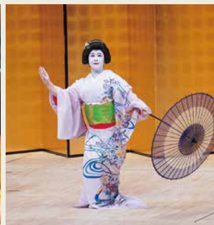
下段の写真は令和7年度市民フォトグラファー・坂本美智子さん撮影