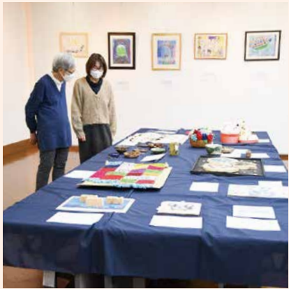
個性豊かな作品を展示

心身障害者福祉センター ☎624・5850 図 624・5954 障害のある方が制作した絵画や手工芸 の展示を行います。 日 1月14～18日の午前9時～午後8時 (18日は正午まで) 会 学園都市センター