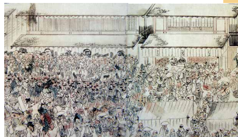
▲朝市でにぎわう江戸時代の八王子（極楽寺所蔵「桑都日記」）

三宿の移転によりまちが作られてきた八王子。江戸時代後期以降は、絹織物の集散地としてさらに発展しました。北条氏照から始まった現在も続く物語は、それぞれの時代の人々によって引き継がれてきたのです。