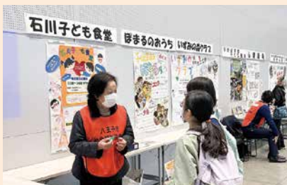
展示などを通して活動を紹介

日 1月12日(祝)午後2～4時 会 クリエイトホール 問 ボランティアセンター(☎673・2011 FAX 666・3315)