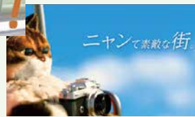
令和5年度八王子市長賞▶ 「ニヤンて素敵な街、八王子。」