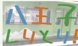
◀ 令和5年度最優秀賞 「八王子しりとり」

問い合わせ 大学コンソーシアム八王子事務局 (☎646・5740 ☎646・2663)