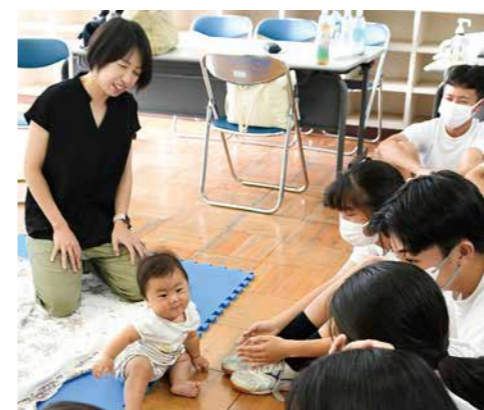
命の大切さにふれる機会に

中学生が、赤ちゃんやその家族とのふれあいを通して命の大切さを学び、豊かな人間性を育む「赤ちゃんふれあい事業」。2・3月に開催するにあたり、妊娠や出産、育児について、お話しいただける方を募集します。