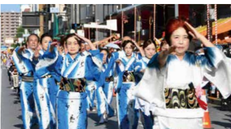
浴衣姿で甲州街道を練り歩く