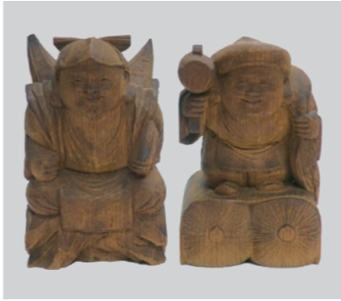
佐藤光重作「恵比寿・大黒天像」

「冬至の日」は親子で 市内の銭湯へ 12月22日の「冬至の日」は市内2 か所の銭湯で小学生以下のお子さ んと保護者1名の入浴料が無料と なります。ご利用の際に銭湯にお申 し出ください。問い合わせは福祉政 策課(☎620・7454)へ。 ※お 子さんのみでの利用はできません。 ▼稲荷湯(子安町一丁目☎642・ 2825) ▼松の湯(小門町☎6 22・5356)