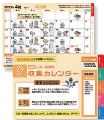
収集日はカレンダーでご確認を

年末は28日(水)まで、年始は4日(水)から受け付けます。問い合わせは、し尿受付センター(☎625・8095)へ。