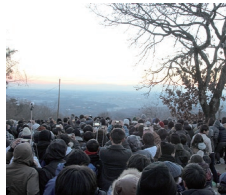
防寒・安全対策は万全に

初日の出を見物する登山客で著しく混雑した場合、事故防止のため高尾山頂への立入規制を実施します。 また、冬季の登山道は凍結により滑りやすいだけでなく、山頂では寒さによる低体温症で救急搬送されるケースも発生しています。十分な防寒対策とトレッキングシューズの着用、懐中電灯を準備するなど、安全対策を行ってください。なお、お越しの際は公共交通機関のご利用を。