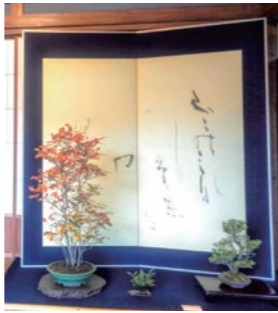
季節に合わせた盆栽を展示(錦秋庭園ぼんさい展)

会 長池公園 定 各10名(先着順) 費 千円 申 10月15日から直接、または電話で長池公園(☎678・4616)へ 高尾駒木野庭園の催し ① 錦秋庭園ぼんさい展 日 11月11～14日の午前9時30分～午後3時30分(14日は3時まで) ② 「なぜ？」に答える盆栽クイズ&ガイド 日 11月12日(土)午前10時30分～11時 定 15名(先着順) ③ 苔玉づくり講座 日 11月13日(日)午前10～11時、午後2～3時 定 各5名(先着順) 費 千円 ④ イラストレーター・つくし展 内容 裏高尾町在住の市民アーティストの作品展示 日 11月23日～12月6日の午前9時30分～午後3時