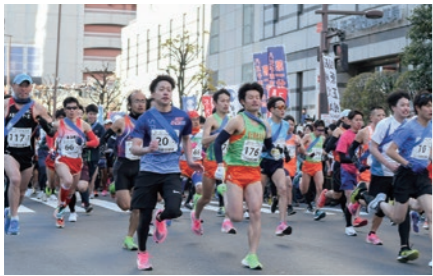
タスキを胸に駆け抜ける(写真は令和2年の大会のようす)

子どものいじめ相談電話(☎620・7499)を開設しています。一人で悩まずにご相談ください。受付時間 月～金曜日の午前8時30分～午後5時