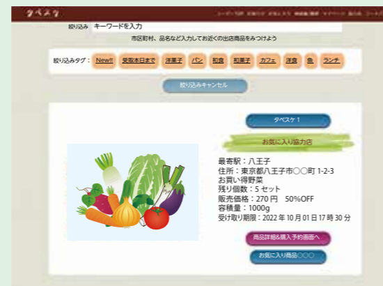
利用画面イメージ