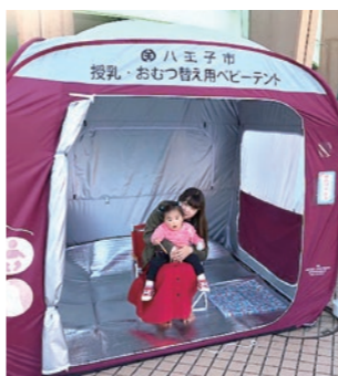
親子向けの催しなどに

子育て中の方が屋外でのイベントなどに、赤ちゃんと一緒に安心して参加できるよう、市内でイベントを開催する団体に「授乳・おむつ替え用ベビータント」を無料で貸し出します。