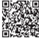
閉庁・休館カレンダー

なお、八王子駅南口総合事務所は大変混雑します。市のホームページ、右の二次元コードからご覧いただける「窓口混雑予想カレンダー」を参考に、時間に余裕をもってお越しください。