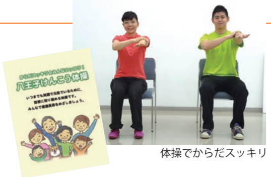
体操でからだスッキリ

いて学びます。 対 市内在住の65歳以上の方が、約10名以上参加できるグループや団体など 日 月・金曜日の午前10時～午後3時(1時間30分程度) 申 市役所1階高齢者いきいき課、各市民センター・高齢者あんしん相談センター、市のホームページで配布する申込書に必要事項を記入して、希望日の1か月前(必着)までに直接、または郵送で高齢者いきいき課(〒192・8501 ☎620・7243)へ